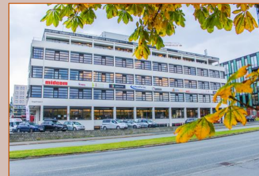
Sorgenfriveien 9, Trondheim